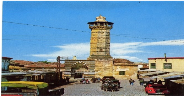
*ADANA ULU CAMİİ