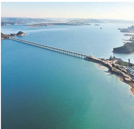
*SEYHAN BARAJ GÖLÜ